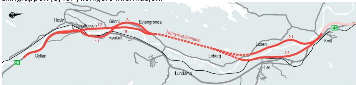
Figur 1-1 Veilinjler som inngår i konsekvensutredningen

De alternativ som utredes i konsekvensutredningen er illustrert i Figur 1-1. Det er gjennom en optimaliseringsfase utført silinger der ulike veilinjler og løsninger er vurdert. Det vises til silingrapport [5] for ytterligere informasjon.