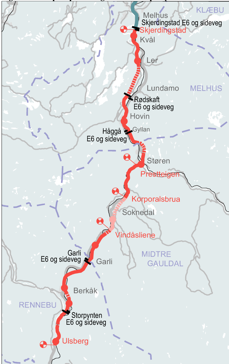
Figur 1: Prinsipiell plassering av bomsnitt på ny E6

Nye Veier AS vil i de kontinuerlige porteføljeprioriteringene avgjøre tidspunkt og rekkefølge på utbyggingen. Det er i de finansielle beregningene lagt til grunn utbygging i årene 2022-2027 med start bompengeneinnkreving fra 2028 i alle bommene. I praksis vil det sannsynligvis være snakk om utbygging av delstrekninger som åpnes fortløpende for trafikk. Det betyr at bompengeneinnkrevingen vil kunne starte noe før det som er forutsatt i beregningene, og at det dermed blir en trinnvis opp- og nedtrapping på den totale bompengebelastningen på strekningen. Det vil kunne legge til rette for et noe lavere takstnivå og eller kortere nedbetalingstid og dermed forbedret samfunnsøkonomisk lønnsomhet.