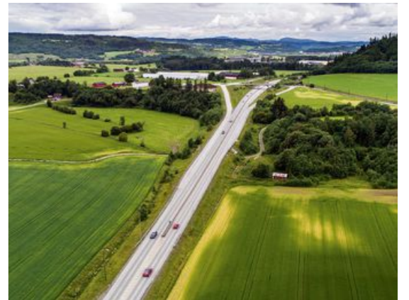
Kryss: Ved Skjerdingsstad i Melhus legges det opp til et omfattende veikryss som vil beslaglegge mye matjord.