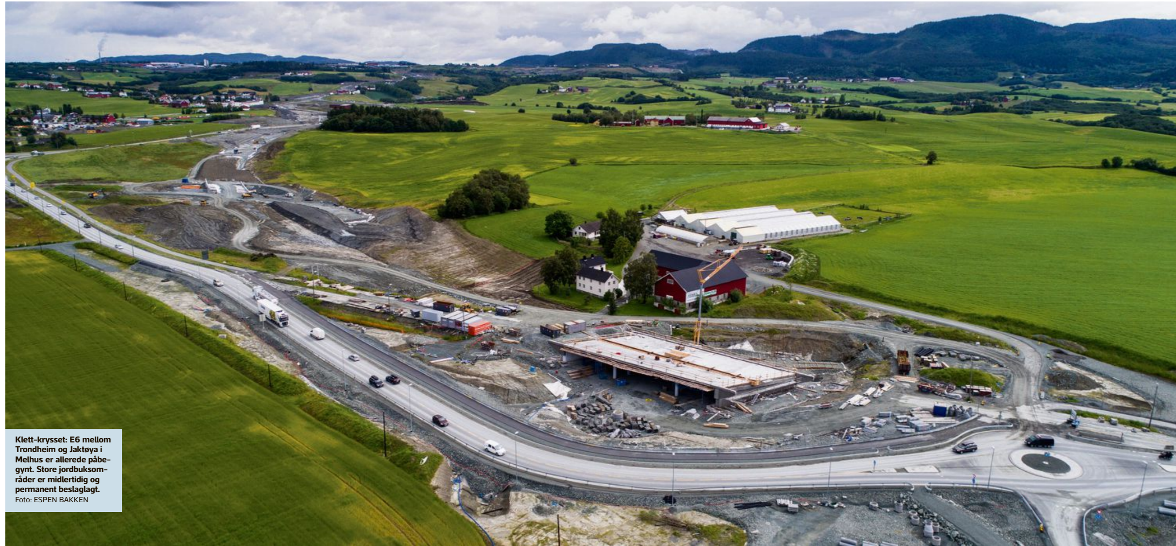
Klett-krysset: E6 mellom Trondheim og Jaktøya i Melhus er allerede påbegynt. Store jordbruksområder er midlertidig og permanent beslaglagt.

Les mer: Les flere økonominyheter på adressa.no